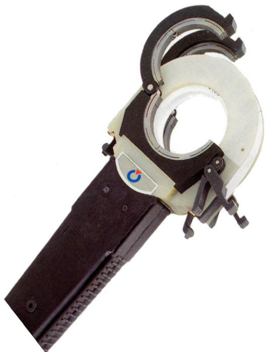
К 2500-2Т с системой крепления по