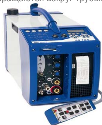
Источник сварочного тока PS идеален для применения со сварочной головкой К