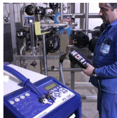
Источник сварочного тока PS164 со сварочной головкой серии MW